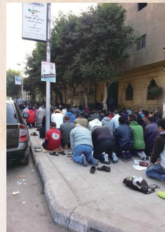
埃及穆斯林在街上拜禱

盼望我們抓緊這些機會，差遣（或是甘心被差遣）宣教士到穆民當中與主同工，收取主的莊稼。最後，請謹記很多穆民朋友已經在我們身處的地方，他們正在尋找更理想、更自由的生活，只要我們用信心行動跟他們做朋友，這也可以是福音的契機。