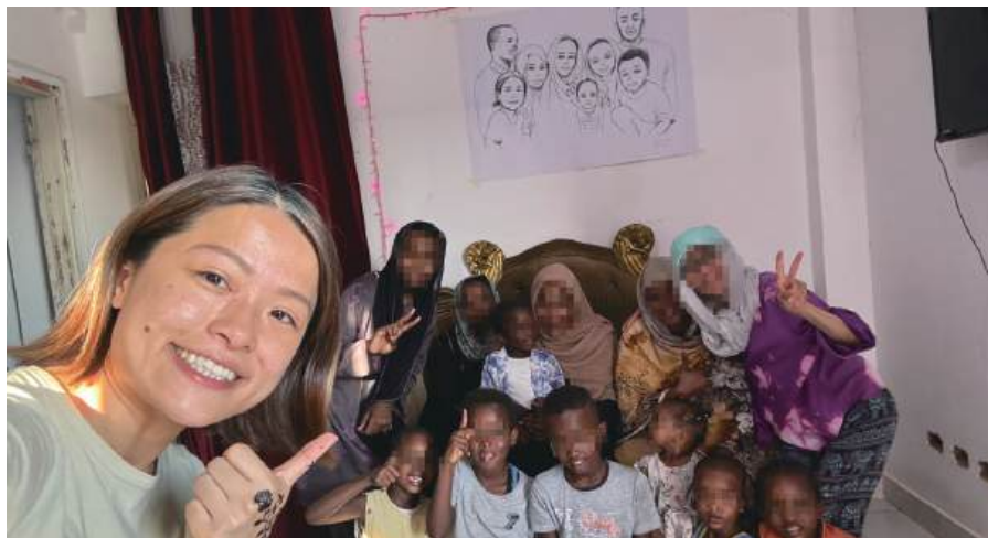
作者跟家主孩子們大合照