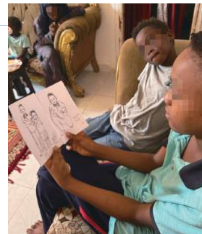
孩子很喜歡人像速寫

感謝天父，讓我的恩賜成為祝福難民家庭的工具。即使我並不完美，神也能使用我。在民宿體驗初期，語言不通的我隨意畫了小女兒的速寫，沒想到她們非常喜歡。後來替不同街坊畫速寫成為了一個特別的環節。這裡紙