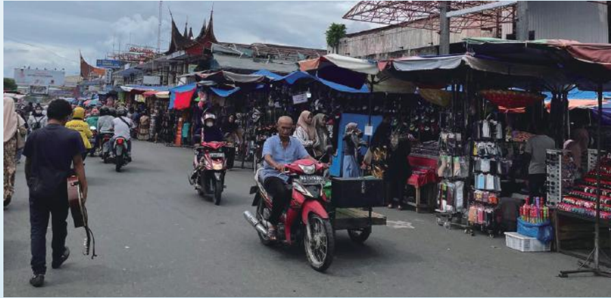
高低音夫婦將會服事的工場

只會在堂會服事五年，之後會繼續尋找宣教路向。母會是一間獨立的教會，以往雖曾差派宣教士，但未曾與差會合作，牧者、長執對差傳沒有很多認識，期盼藉著我們能幫助教會更多認識宣教。話說回頭，其實新冠疫情差點令我忘卻五年之約，我們 2019 年結婚，各自在自己的母會事奉。2022 年 1 月，我還在教會做錄像剪接時，神突然向我說：「你為何浪費時間？以為疫病就會使宣教工作停下來嗎？」一言驚醒，我於是馬上在網上搜尋，因而接觸了前線差會。直到去年，成為準宣教士。