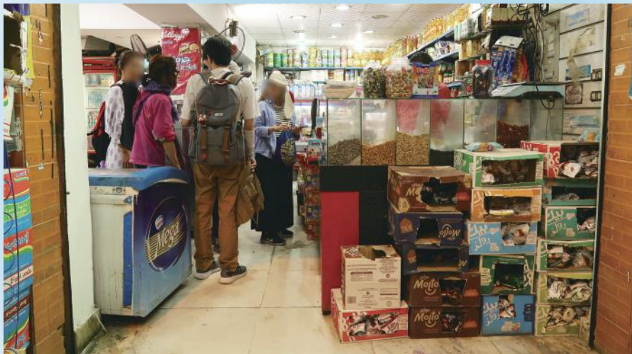
青宣的經歷鍛鍊了年青人對神的信心

我們要求整個青宣團隊每早一起靈修，並彼此禱告，常以 WWJD (What will Jesus Do) 作為每日行事的首要