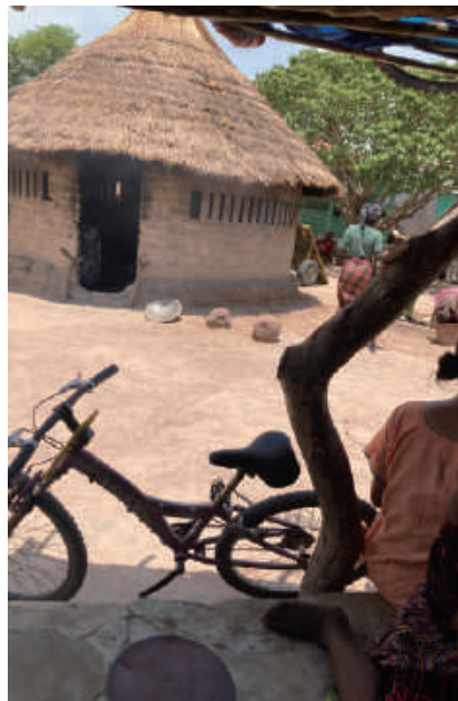
當地人所住的房子

你想回應神給你的召命——就是那個可能在人看來有點匪夷所思的呼召，勇敢地憑著信心踏上，以致享受神緊密的同行，以及神所預備那超乎想像的祝福嗎？☛