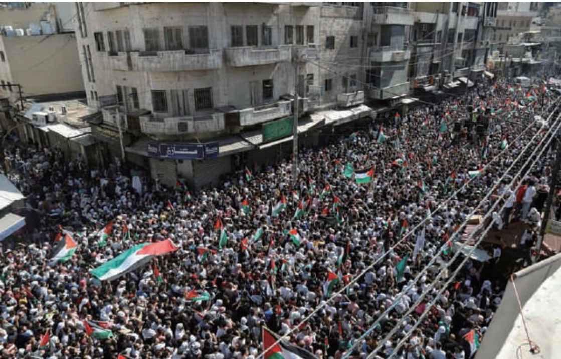
約旦民眾街上聚集，聲援加沙的巴勒斯坦人

在阿拉伯國家，主流聲音自然是要聲援巴勒斯坦人，例如伊朗、伊拉克和約旦有數以萬計的人集會，揮舞巴勒斯坦旗幟以及焚燒以色列國旗。較少人留意的是日本也有穆斯林在以色列駐東京大使館附近示威，高叫「以色列恐怖分子」和「解放巴勒斯坦」等口號。 4