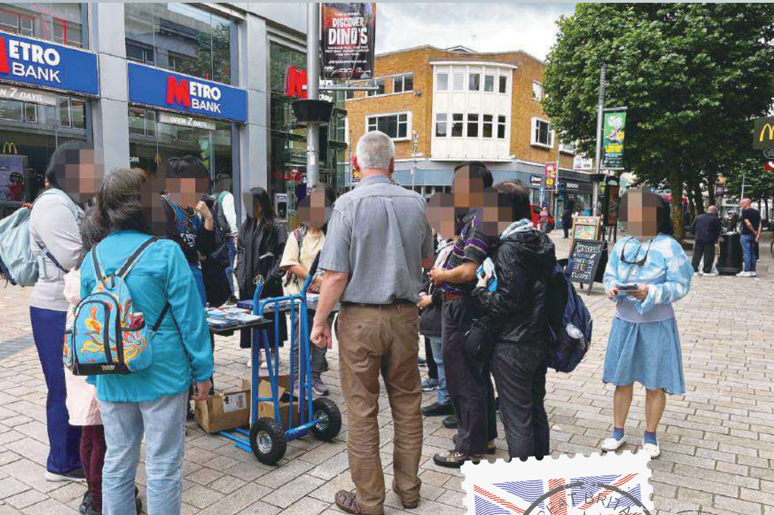
在伯明翰街上設書攤，接觸穆斯林