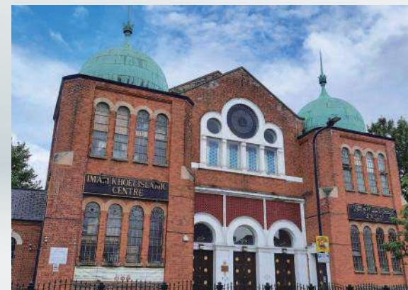
教堂改變為清真寺

最深刻的穆民印象：土耳其人大多是穆斯林，在英國倫敦已有50萬人，多是年青人，心是開放的，以歐盟身分隨時可在英國居留，他們多數開辦理髮店和餐館。在英國向土耳其人宣教的，有一個保加利亞土耳其裔人信主後，以自籌薪金（織帳棚）的方式來向土耳其人傳福音，在很短時間內，開了兩三間教會。