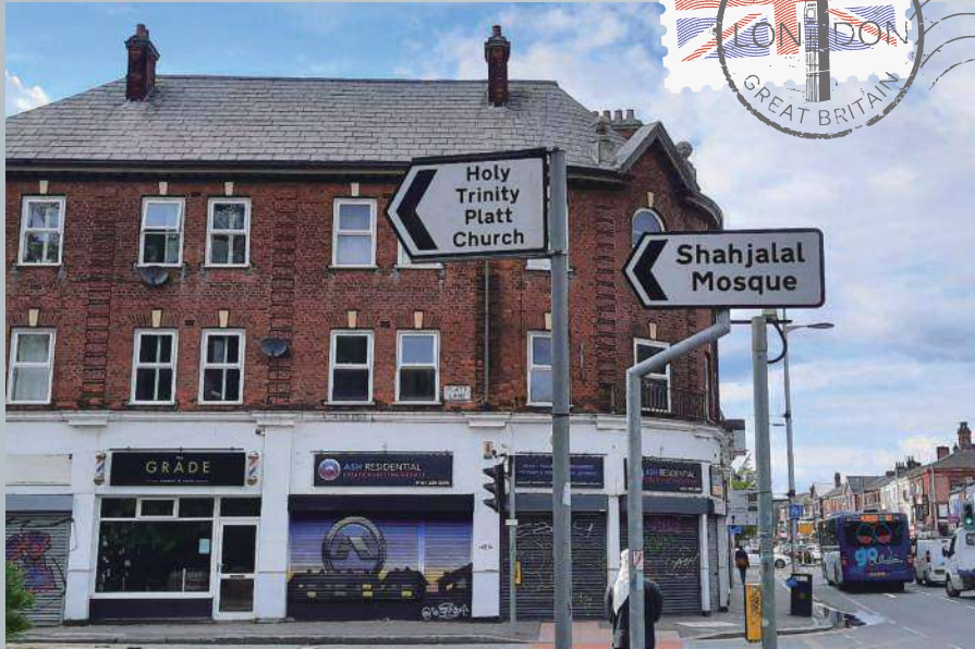
路牌顯示清真寺距離教堂很近，而伊斯蘭的勢力也步步進逼

不一樣的團友：我們的團友有牧師傳道、老師、醫護界朋友、行政人員、退休人士和年青人。其中有剛移居英國的，也有人在考慮中，有對宣教很有熱誠而參加的，尤其穆宣。當中也有已被神醫治了的團友能活潑自如地生活；有行動不便的，左邊半身不遂的弟兄分享他死而復生、遇見上帝的見證。大家彼此配搭，互相幫助，全無障礙。我身為護士，最喜歡幫助人，好像無用武之地，就走去廚房洗碗。隨團的牧師夫婦以及宣教士夫婦，都跟大伙兒很合拍，且成為我們的好榜樣。