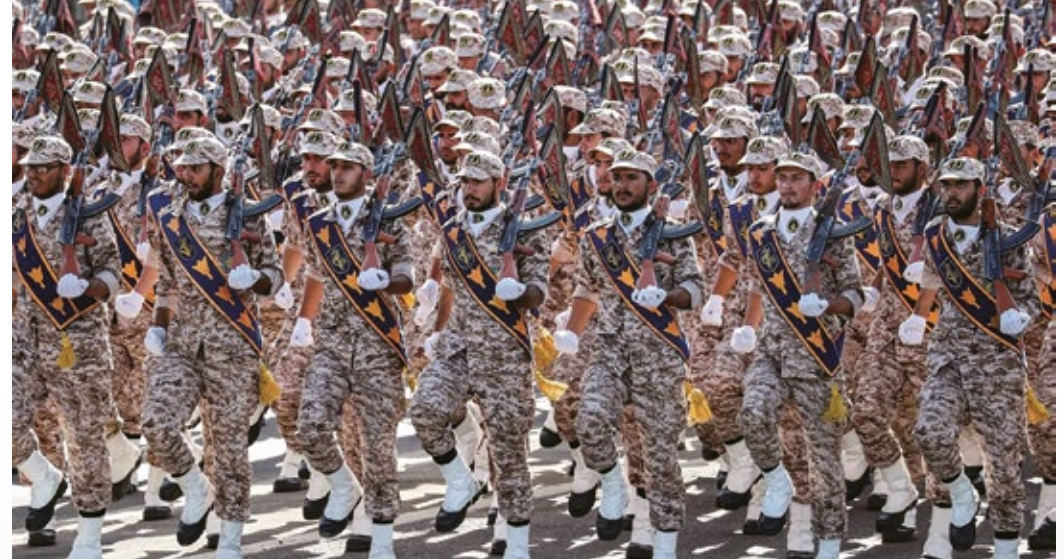
伊斯蘭革命衛隊的地位比正規軍還要高

隨著社交媒體滲透到伊朗人民的生​​活，哈梅內伊早已警覺伊斯蘭共和國的基本價值觀受到衝擊，所以多年來一直呼籲伊斯蘭神職人員、教授和宣傳人員，抵制他口中一心想通過軟戰爭摧毀伊朗、由多個西方國家組成的「文化北約」，甚至曾指「這是真正的戰爭」。然而，世俗風氣蔓延下，年青男女在德黑蘭的咖啡店自由約會，富裕的城市居民在裏海沿岸置