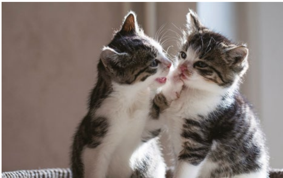
與可愛的小貓相處是寶貴的學習

刺鼻的濃烈的氣味直使我作嘔。其後我想到一個不是太好的方法：每當清潔時，我竭力憋氣直到清理完畢。然而，我有時憋氣已盡，唯有立刻放下清理工具，直衝進洗手間吐出口水，因為那口水仍附著那遺留的異味，令我不斷反胃作嘔！每當我想起清潔時的狼狽模樣，就忍不住大笑起來！