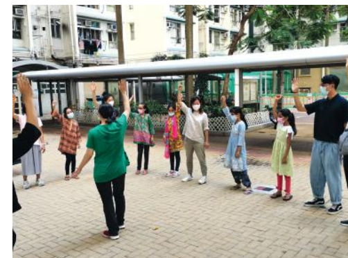
參與社會服務，接觸南亞孩童