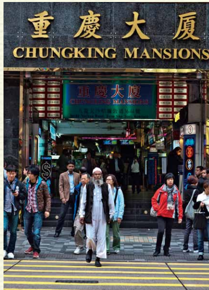
尖沙咀重慶大廈是南亞裔穆民聚集的地方

3) Engage (與穆斯林接觸並投入當中) ：這裡的接觸當然不是指到在街頭派派單張，而是直接和穆民交朋友，誠摯地關心他們，並和他們分享我們在基督裡的生命，進而把基督介紹給他們。經驗告訴我們，很多時候，辯論不能叫我們贏得穆斯林（雖然有時智慧的答辯是有需要的），反而是我們能「活出基督」，並透過我們的生命把聖經真理展現，更能為主贏得穆斯林。聖經約壹四18說到「愛裡沒有懼怕」是真的，假若我們有著一顆愛穆民的心，你會發現，要“engage”他們不是那麼困難的事。誠然，要切實的“engage”穆