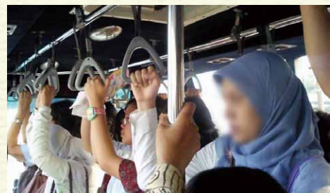
穆民就生活在我們當中

2) Learn (學習) ：當我們越是關心穆斯林為他們逼切禱告，神亦會在我們內裡栽種一顆愛他們的心，並越會想念可如何和他們接觸，也會越肯在各方面裝備自己好能與他們分享基督。事實上，伊斯蘭教義有很多自相矛盾的地方，在不少伊斯蘭教義的執行上也眾說紛紜，不少穆斯林也覺得伊斯蘭本身問題多多；同時，人活在以行功德為本的伊斯蘭教義下，罪的問題完全不能解決，更沒有上天堂的把握；現在坊間也有不少書本、網站及課程能讓我們得著裝備，以合宜的方式和穆斯林分享我們的信仰。（前線差會也出版了一些相關書目，也會於4月4-9日開辦「認識伊斯蘭」及「與穆斯林辯解福音」課程，歡迎到前線差會網站 www.frontiers.org.hk 瀏覽相關細節並報名）