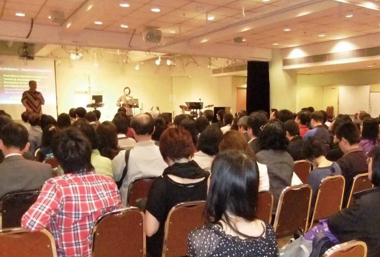
堂會牧者及肢體參與「本地印傭事工座談會」