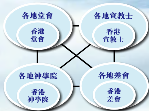
圖三：普世教會透過伙伴合作完成天國使命

（Global Initiative）功能單位，透過動員在工場中的本土基督徒群體起來投身參與穆宣，從而在世界舞台建立更多元化的宣教團隊，務求以各式各樣的方法把福音帶給穆斯林。