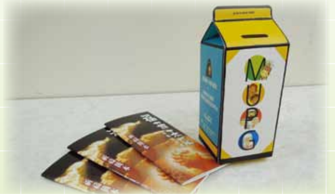
祈禱簡本及奉獻嘜

未來五年，差會致力推動教會認領十五個福音未及之穆斯林族群，盼望透過禱告、關愛和參與穆宣，能差派工人到未及之穆民族群中作長期宣教。這工作殊不簡單，不能只由差會來承擔，宣教本是眾信徒、眾教會的使命啊！改變由生活開始，簡單的如使用祈禱簡本和「奉獻嘜」，就可具體地參與穆宣！小記當日亦作出了回應，並索取一些奉獻嘜給教會使用。