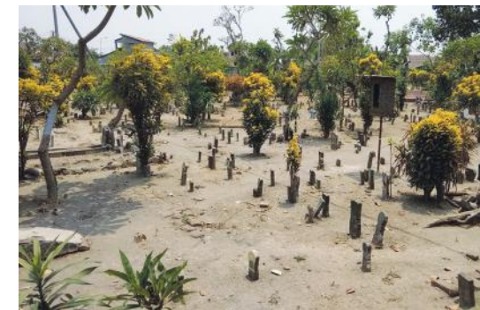
這墓園所埋葬的，大多是無名無姓的，有多少人曾聽聞福音？

主耶穌說：「我就是道路、真理、生命，若不藉著我，沒有人能到父那裡去。」（約十四 6）