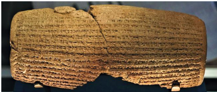
塞魯士圓柱，現收藏於大英博物館