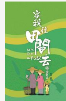
容我往田間去——穆宣拾穗 若活著 前線差會出版

面對世上各處不斷發生的災難，不論我們是到前方參與救災，或在後方以不同的方式作支援，惟願你我都能成為祝福的管道，讓神的愛傾流而下。☞