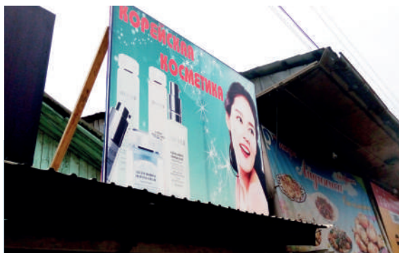
商店門前的韓國化妝品招牌

最初我來這兒的時候，和本地人住在一起，第一件事令我震驚，就是那位家主太太看俄語配音的韓國連續劇。她不是偶然看一套，而是看了一套又一套，並說其他婦女像她一樣，都喜歡韓劇。後來我到市集看看，發現有很多韓劇影碟，這位太太所言非虛。那麼，本地少女會喜歡韓國偶像明星