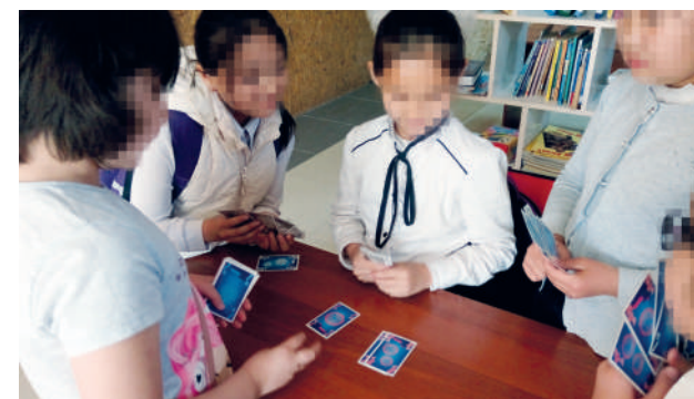
桌遊有助學生鍛煉腦筋

本地人對外來潮流越來越接受，深願對福音也會越來越開放，甚至出現大規模的歸主浪潮。☞