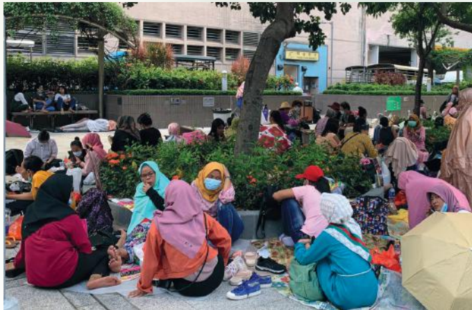
▲限聚令收緊之前，姐姐們三五知己歡聚

網上。一向人手資源短缺的印尼事工，牧者為求持續牧養主內的群羊，得想辦法設立網上平台。可是印尼姐姐透過虛擬平台來互動較為困難，且要面對資源不足的問題。牧者表示有些姐姐不喜歡用「Zoom」，不是怕學習用新平台，而是手機的流動數據有限，開啟視像會議不足一小時，便消耗了數據卡大半的用量。有些較便宜的上網卡，接收訊號的質素參差，影響人投入網上聚會。此外，有些姐姐為了節省金錢，在